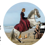
table ronde philosophie et équitation

Les données qui ont fondé notre équitation sont-elles dépassées ?