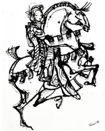
Dessin Sara Foxa

Les rencontres d'Arts Équestres Libres, un espace pour inventer un peu l'équitation de demain, grâce à vous tous.